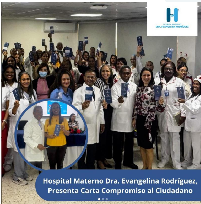
Hospital Materno Dra. Evangelina Rodríguez, Presenta Carta Compromiso al Ciudadano