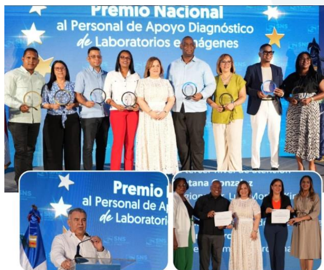
SNS celebra la segunda edición del Premio Nacional al Personal de Apoyo Diagnóstico

📱 Conozca más en #EnSaludDigital ensaluddigital.gob.do