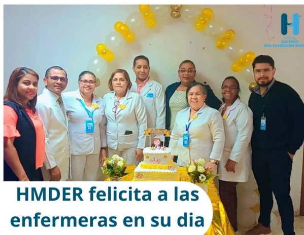
HMDER felicita a las enfermeras en su día