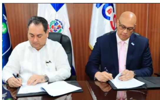
SNS y Centro Nacional de Ciberseguridad fortalecerán seguridad digital Red Pública de Salud

Igualmente, ambas instituciones se comprometen a movilizar sus recursos humanos y tecnológicos de acuerdo con la programación y las tareas a desarrollar en los proyectos de cooperación.